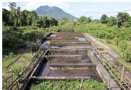
USAID IUWASH PLUS SSEI Instalasi Pengolahan Lumpur Tinja di Takome, Kota Ternate

Berdasarkan Data EHRA di 2014, 85,42% dari penduduk Ternate telah memiliki tangki septik. Tetapi, 81,5% dari penduduk tidak pernah mengosongkan tangki septiknya dan sementara itu 53,7% tangki septik telah dikosongkan oleh layanan sedot tinja. Berdasarkan Buku Putih Sanitasi Kota Ternate (2014), pada umumnya penduduk masih memanfaatkan badan air terdekat sebagai tempat pembuangan air limbah domestik yang langsung disalurkan melalui saluran air yang ada. Kondisi ini tentu menyebabkan terjadinya pencemaran air tanah, badan air, dan lingkungan.