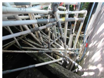
USAID IUWASH PLUS SSEI Pipa tersambung ke sumur komunal di Kelurahan Makassar Timur, Kota Ternate

Berdasarkan Data EHRA di 2014, 85,42% dari penduduk Ternate telah memiliki tangki septik. Tetapi, 81,5% dari penduduk tidak pernah mengosongkan tangki septiknya dan sementara itu 53,7% tangki septik telah dikosongkan oleh layanan sedot tinja. Berdasarkan Buku Putih Sanitasi Kota Ternate (2014), pada umumnya penduduk masih memanfaatkan badan air terdekat sebagai tempat pembuangan air limbah domestik yang langsung disalurkan melalui saluran air yang ada. Kondisi ini tentu menyebabkan terjadinya pencemaran air tanah, badan air, dan lingkungan.