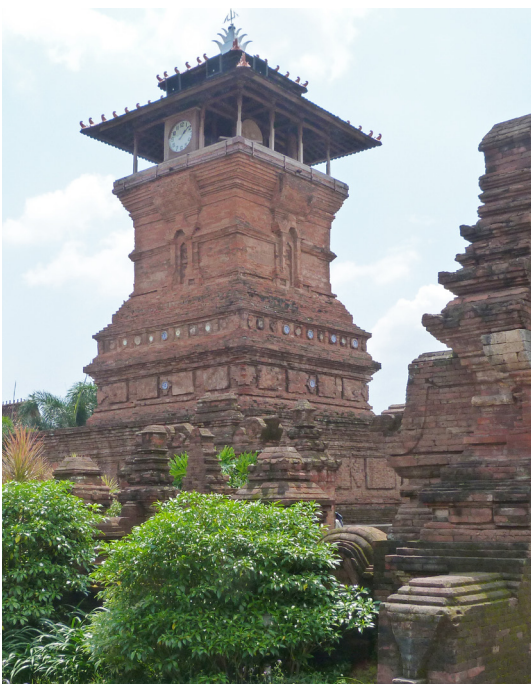
Masjid Menara Kudus: sebuah masjid yang dibangun oleh Sunan Kudus pada tahun 1549.

Kabupaten Kudus: terletak 50 kilometer di sebelah timur Kota Semarang dan berpenduduk 800.000.